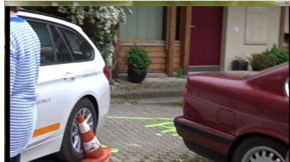
Er hat aber keine Anstalten zum Halten zwecks Informierung gemacht.