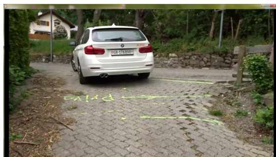
Nach dem Baukegel umfahren, schiesst er in den Mittelweg davon .