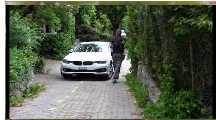
Mit dem Fuss versetzt er den Baukegel. Den Stab nimmt er mit ins Auto.