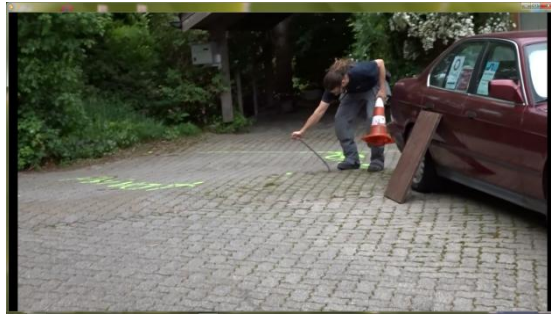
Gegen 19:22h zerstört er den Besitzschutz zum 2. Mal